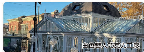
白色戀人巧克力工廠