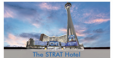
The STRAT Hotel