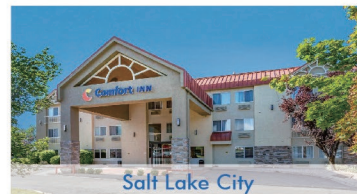
Salt Lake City